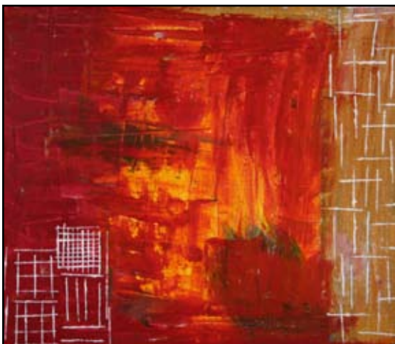
Jaipur les portes de la ville

Avec l'œuvre de Thierry Esther, nous faisons le chemin inverse de l'individu de Platon, séparé de ses semblables restés enchaînés, émancipé de force, et exposé à cet inconnu qu'est le réel dont l'éclat surpuissant l'éblouit et est source de douleurs. Bien entendu, il ne s'agit pas d'un voyage en terre de déni ou d'une régression cognitive. Il est plutôt question d'un déplacement de l'attention du public, le temps d'une parenthèse artistique.